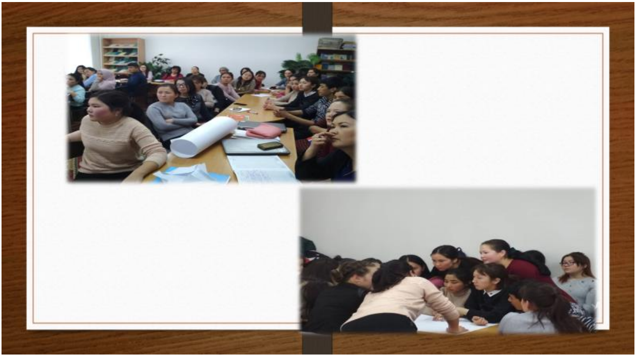
Магистранттар группа менен иштеп, талкууга катышуу учуру