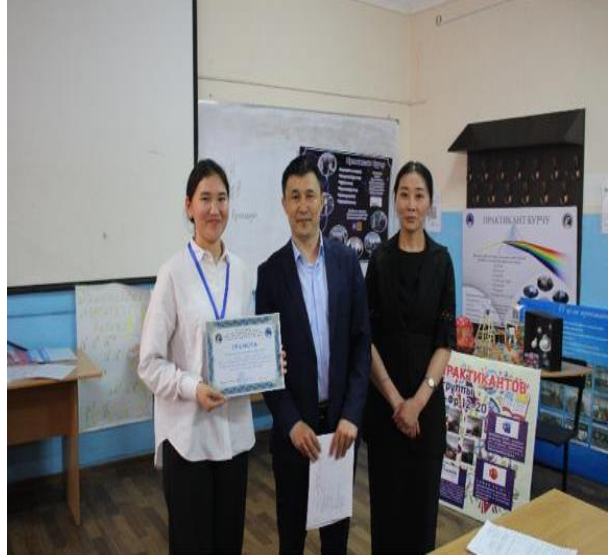
Кесиптик-базалык практиканы жыйынтыктоо конференциясы