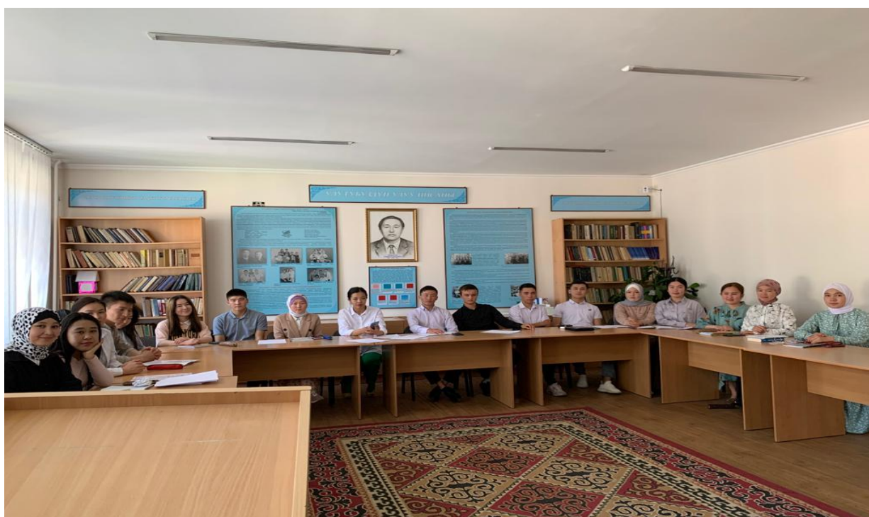
Студенттер менен жолугушуу учуру 2022-ж