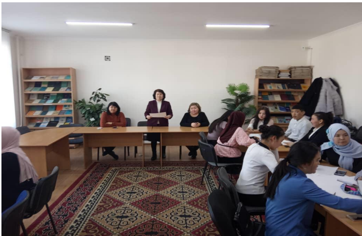
Проф. К.М.Торогельдиева семинар өтүүдө 2021-ж.