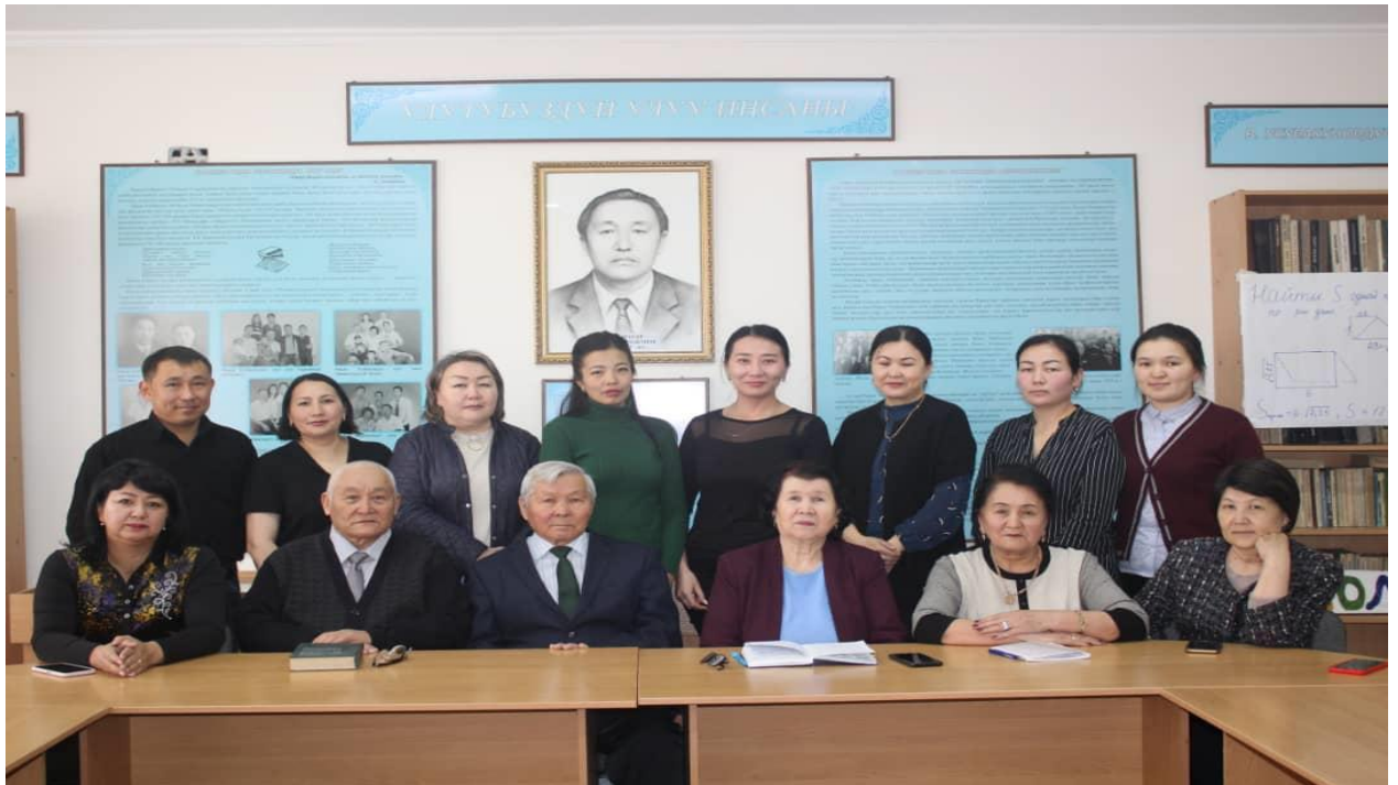
Кафедранын мүчөлөрү, 2022-ж.