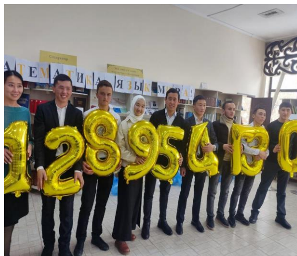
“Математика-язык мира” аттуу математикалык кечеси. 2022-ж.