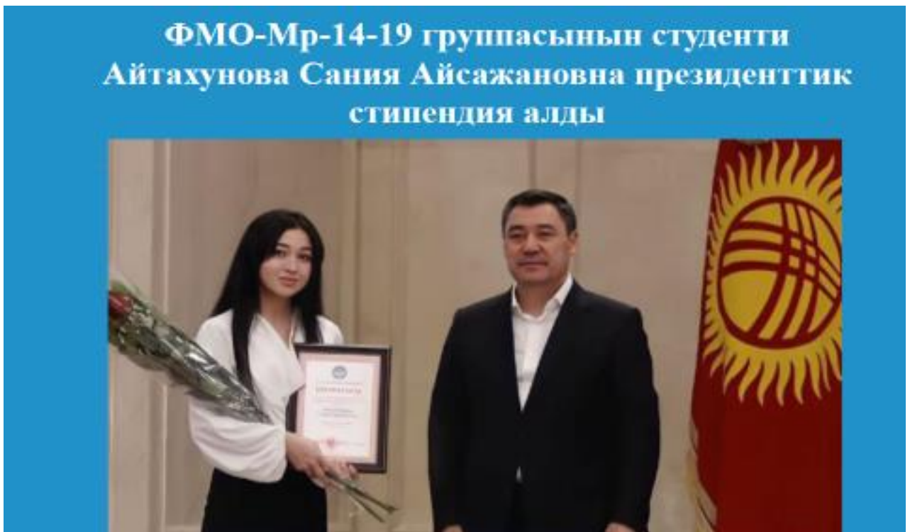
Кафедранын сыймыгы, 2022-ж.