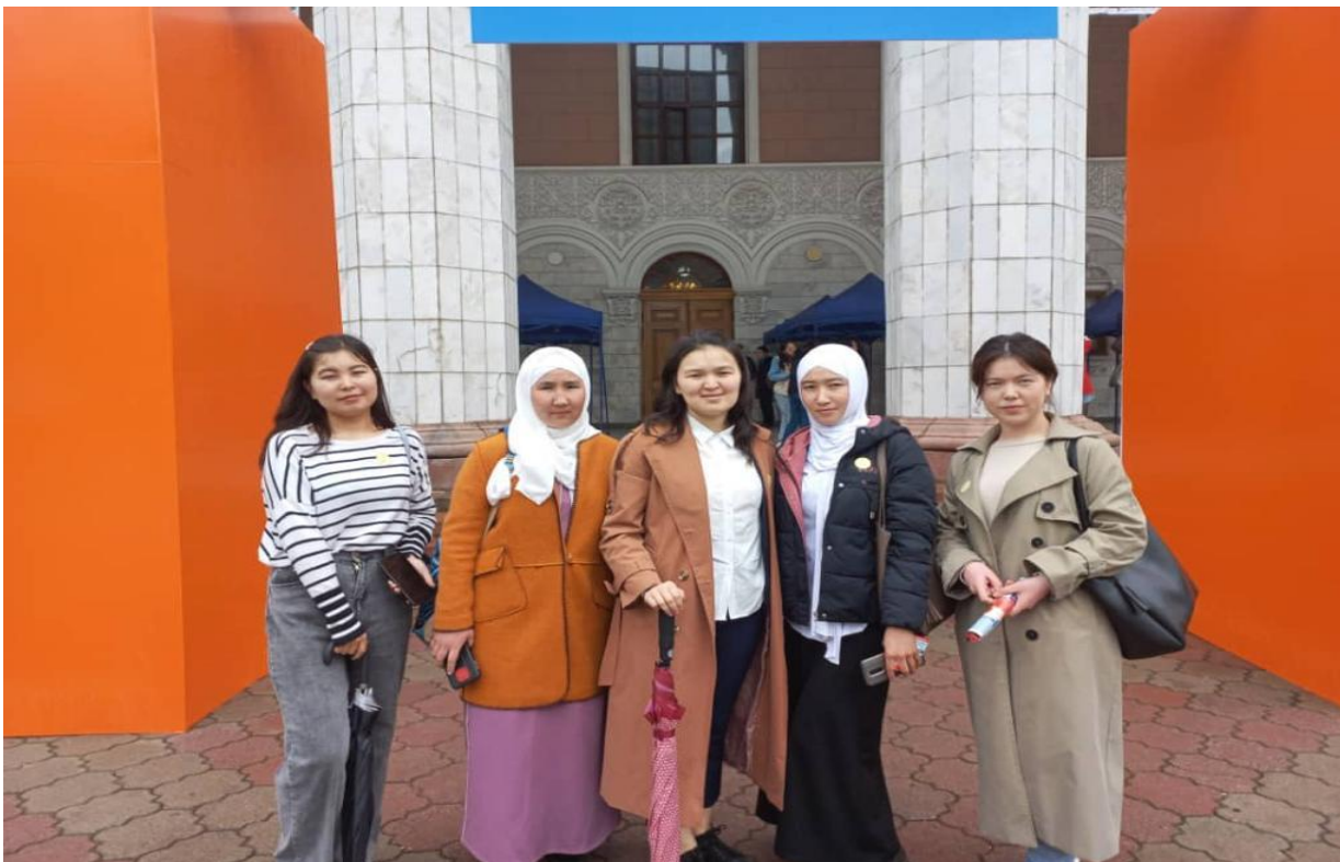
Вакансиялар жарманкеси, 2022-жыл