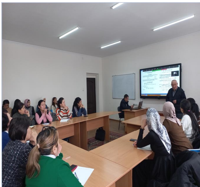
Алымбаев А.Т. “Численные методы исследования краевых задач” деген темада доклад учуру