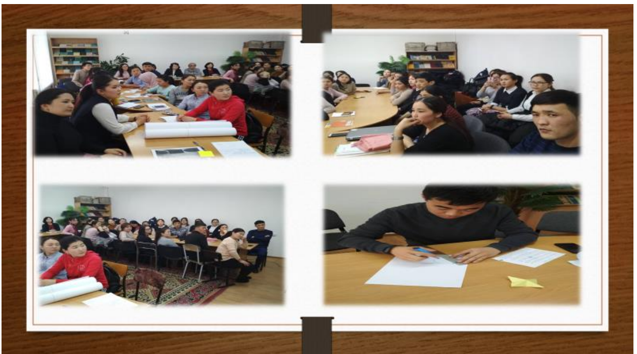
Студенттер группа менен иштеп, талкууга катышуу учуру