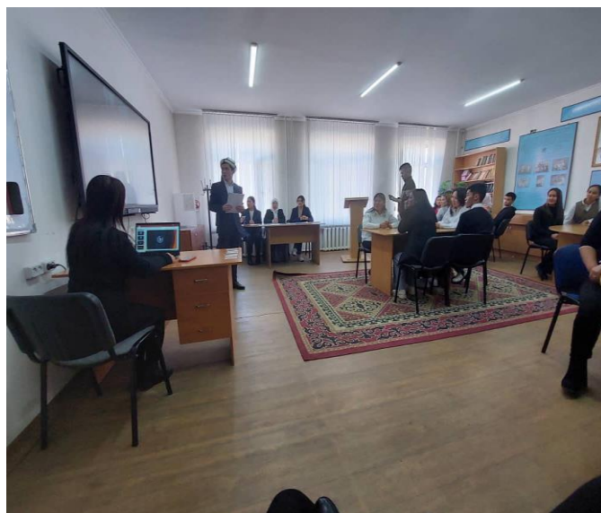
“Билим” клубу аталышындагы интеллектуалдык оюн 1-2-курсун студенттери арасында. 2022-ж.