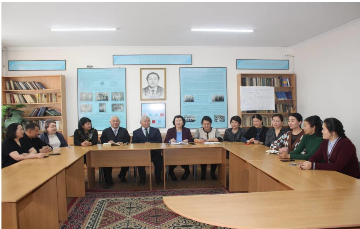
Кафедранын мүчөлөрү илимий-методикалык семинар учурунда, 2022-ж.