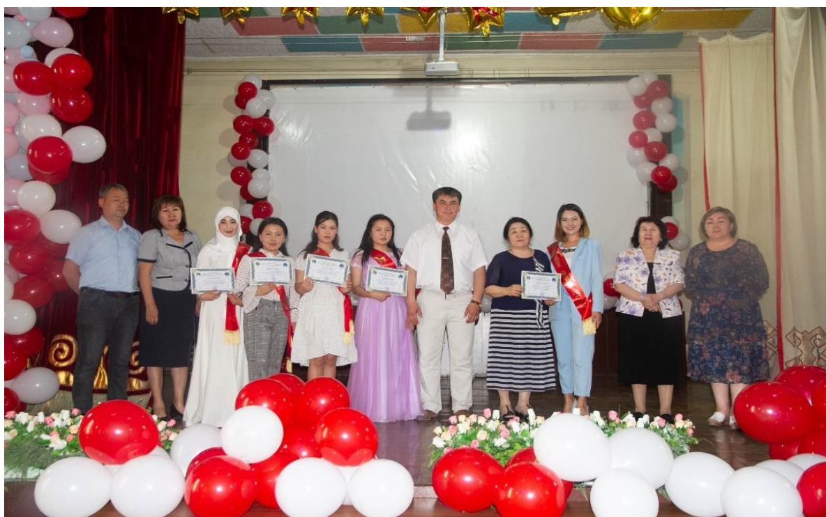
Студенттердин бүтүрүү кечеси. 2021-ж