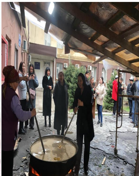
Сүмөлөк бышыруу учуру. 2022-жыл