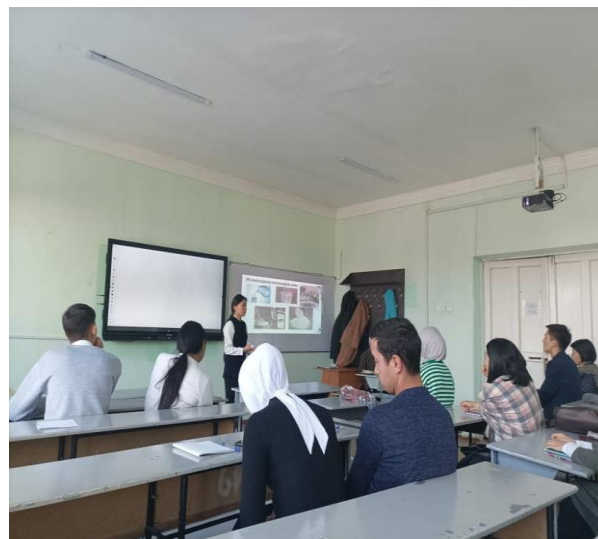
“Математиканын физикадагы, химиядагы орду” атуу методикалык семинар учуру. 2022-ж.